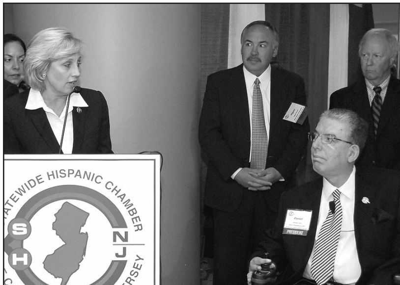
La vice gobernadora Kim Guadagno nominada con el premio a la defensora del sector publico, aparece en esta foto junto al presidente de SHCC Daniel H. Jara

Newark, NJ - La Cámara de Comercio Hispana del Estado de New Jersey (SHCC) celebró la entrega de Premios de Liderazgo Hispano y Excelencia Empresarial 2011 durante la 21va. Convención Anual Expo, Feria y Segundo Festival Internacional Gastronómico realizada el lunes 17 de octubre de 2011 en el Hotel Marriott at Glenpointe en Teaneck, New Jersey.